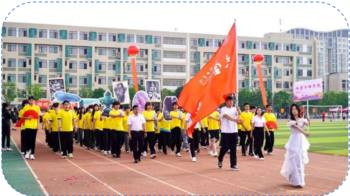
图 38：珠宝玉雕学院运动会方阵