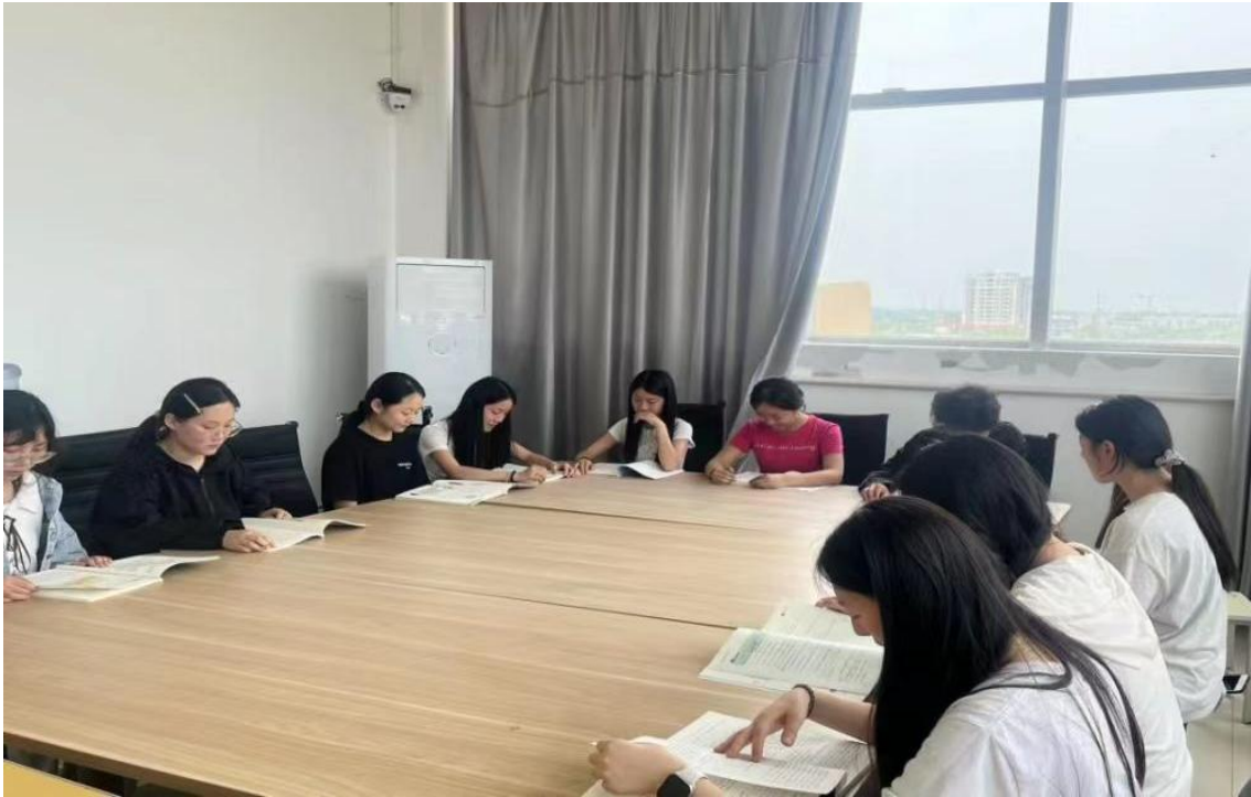
图 24：人文艺术学院阅读分享会现场