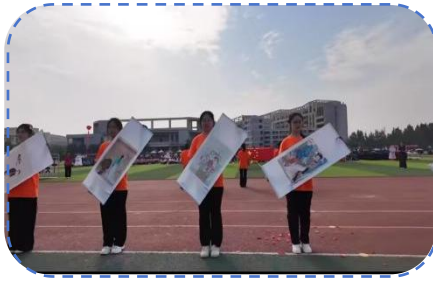
造型艺术学院书画展