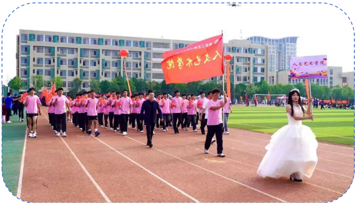
图 34：人文艺术学院运动会方阵