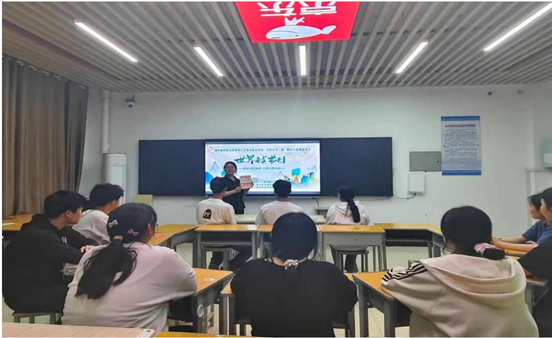
图 22：商学院阅读分享会现场