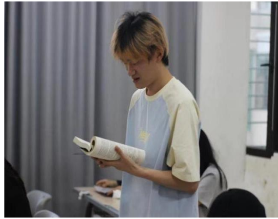
图 25：社团阅读分享会现场