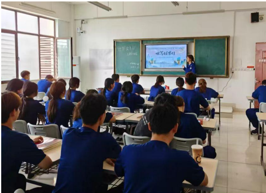
图 23：现代技术学院阅读分享会现场