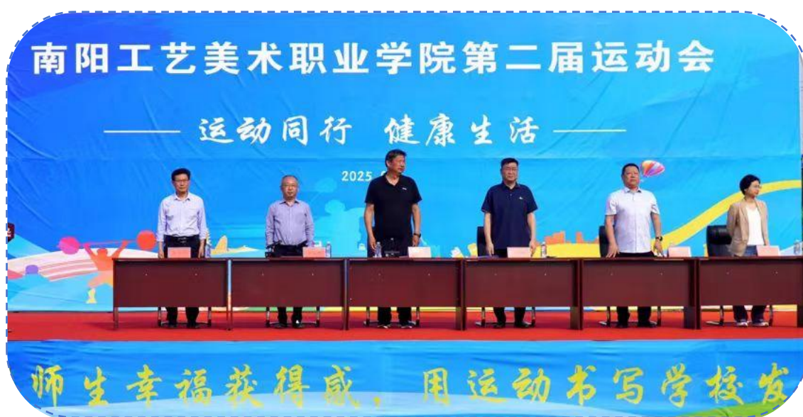
图 26：校领导出席第二届学校运动会开幕式

校园运动会经校团委精心准备，于2025年4月27日圆满落幕。活动组织方面，校团委与各二级学院、社团紧密合作，确保校园运动会顺利进行。参与情况方面，各二级学院师生积极响应，各学院代表队在开闭幕式和赛事中展现出色团队精神。赛事项目丰富多样，涵盖田径、球类等比赛。经过两日激烈比赛，各项比赛成绩突出，不仅锻炼学生身体，也培养他们集体荣誉感和拼搏精神。此次运动会的成功举办，不仅是对我校体育运动工作的全面检阅，更丰富了校园文化建设。