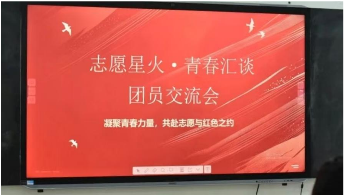
图 8：青年志愿者协会开展团员交流会