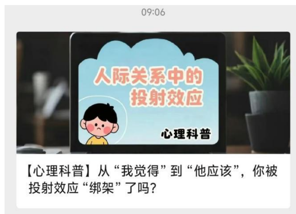
图 52：心理健康中心利用公众号普及心理健康知识