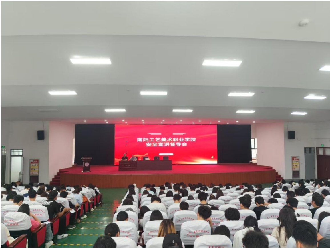
图 55：安全宣讲督导会