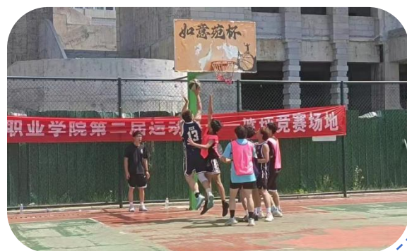
图 42：运动会场精彩瞬间