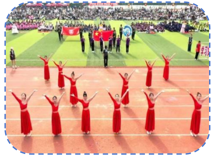
歌舞合唱《再一次出发》