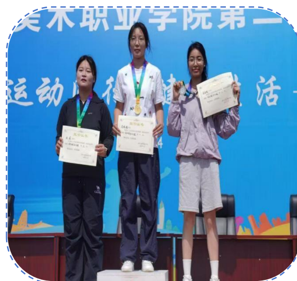
图 44：运动会学生颁奖仪式