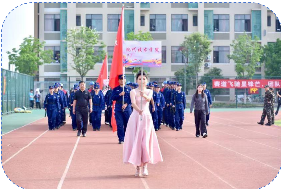
图 36：现代技术学院运动会方阵