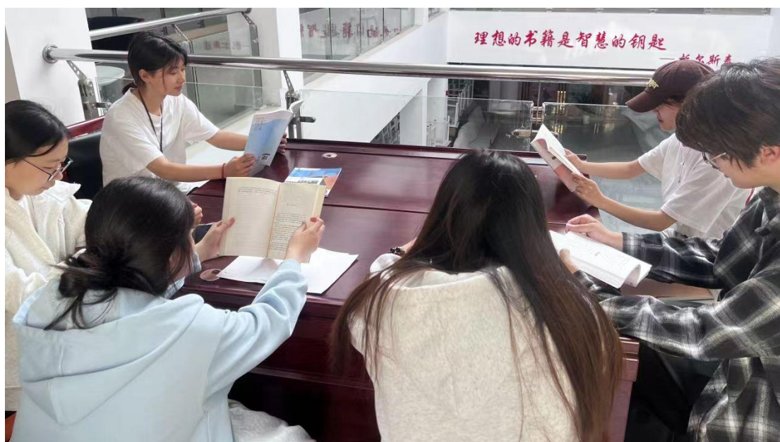
图 21：产品设计学院阅读分享会现场