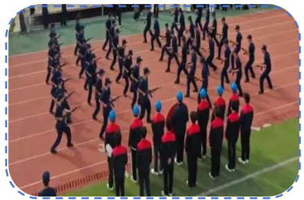
现代技术学院方阵表演