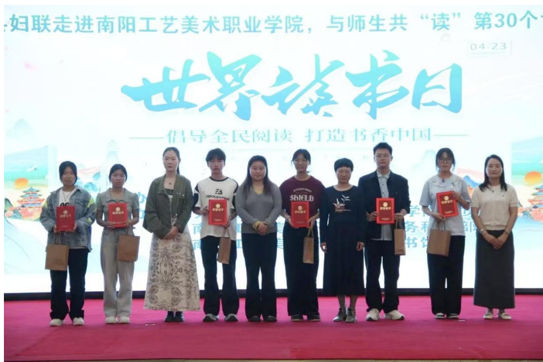
图 15：世界读书日活动学生颁奖仪式