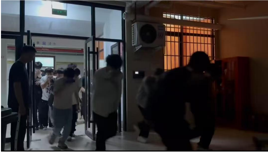
图 54：保卫处举办宿舍消防疏散演练活动