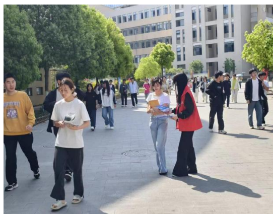
图 51：“防骗常留意·反诈击记心间”校园反诈宣传