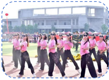
人文艺术学院方阵表演