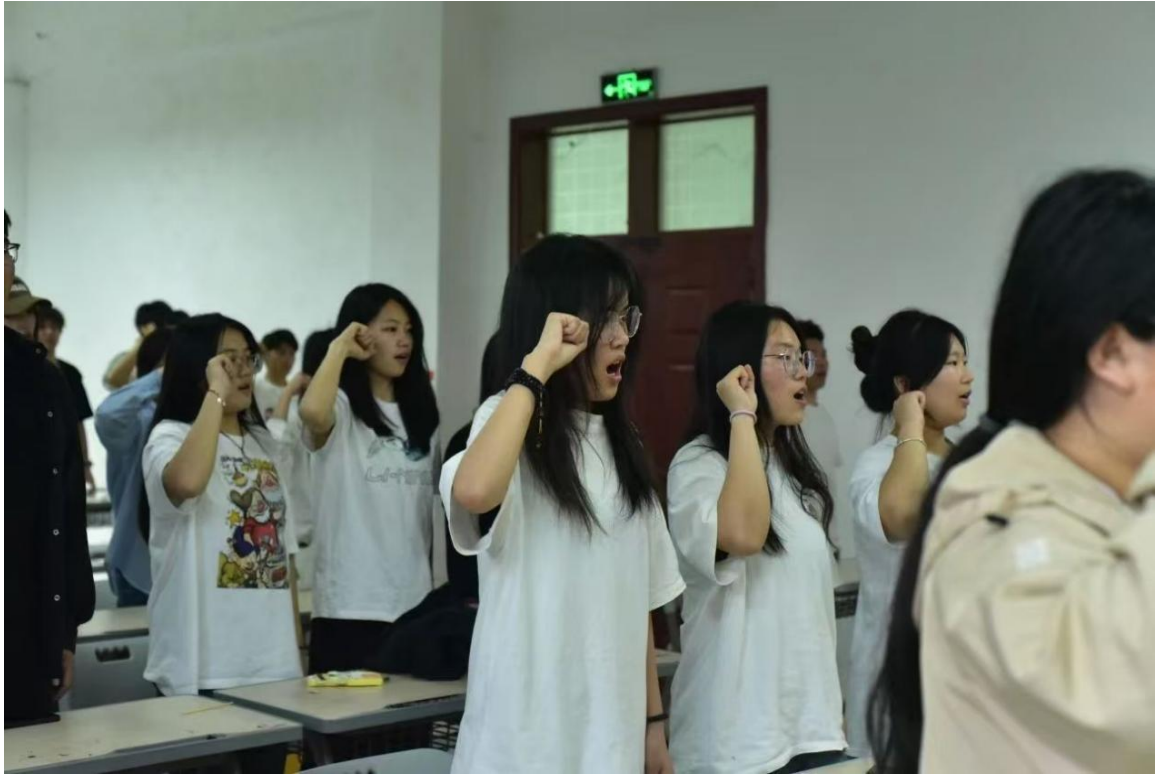
图 10：共青团员宣誓仪式