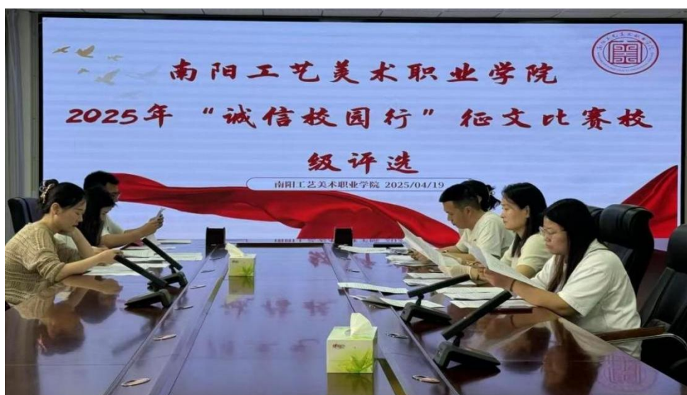
图5：“诚信校园行”征文比赛评选现场

2025年4月19日由学生工作部、教务科研部和校团委联合承办，以“守诚信之本，怀感恩之心”主题的“诚信校园行”征文大赛圆满结束。此次比赛旨在通过征文的形式，引导学生思考诚信的重要性，营造诚信的校园文化氛围。