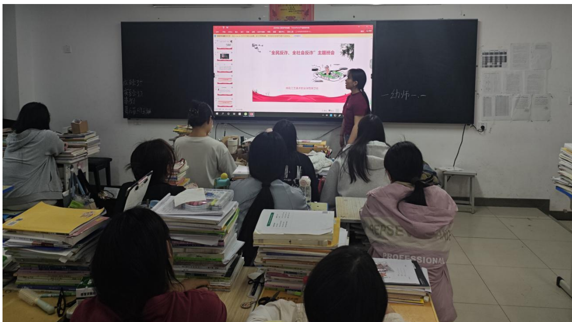
图 46：人文艺术学院“全民反诈”主题班会