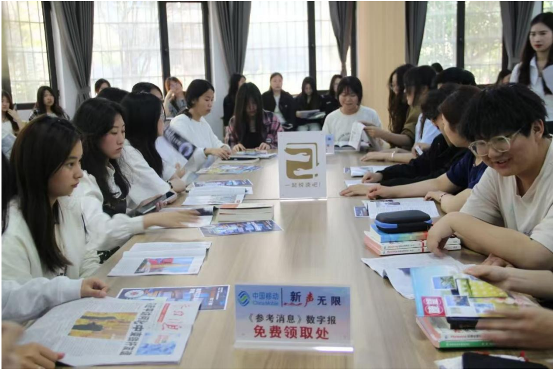
图 19：新华社《参考消息》数字报师生阅读分享会现场