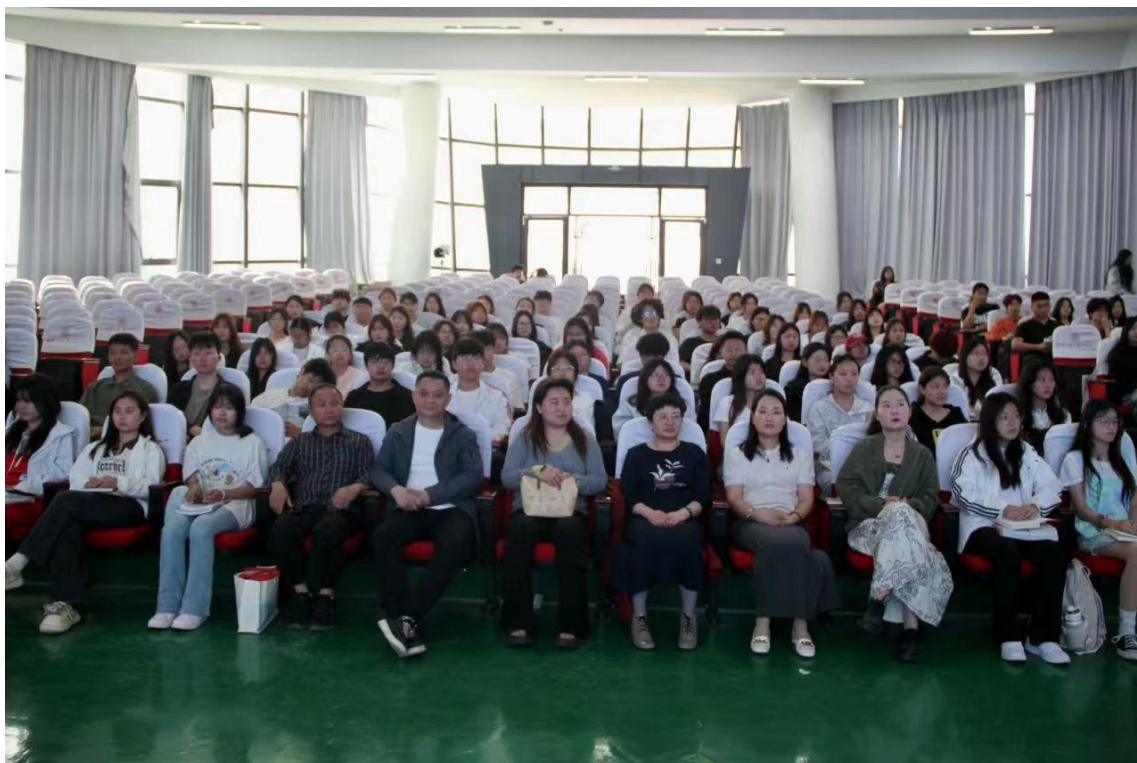
图 12：师生参加世界读书日活动