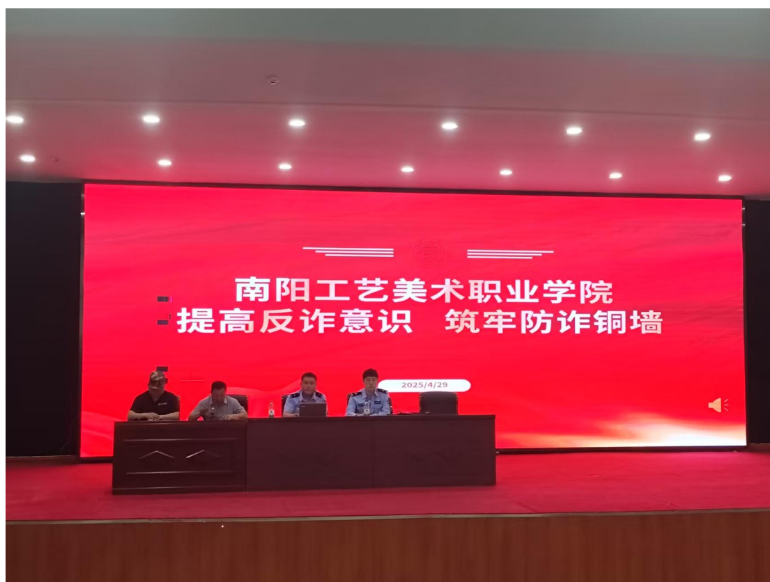
图 56：反诈防范培训会

业务都将被暂停；提出“五不两要倡议”，即不贪心、不轻信、不惊慌、不透露、不转账、要及时核实信息、要及时报警等具体措施；倡导下载国家反诈中心 APP 软件。最后，强调普法宣传的重要性，倡导师生共同参与，构建反诈防骗防线，保护自身及他人的财产安全。此次培训会旨在持续提高师生对诈骗行为的警觉性，增强防范技能，构建和谐安全的校园环境。