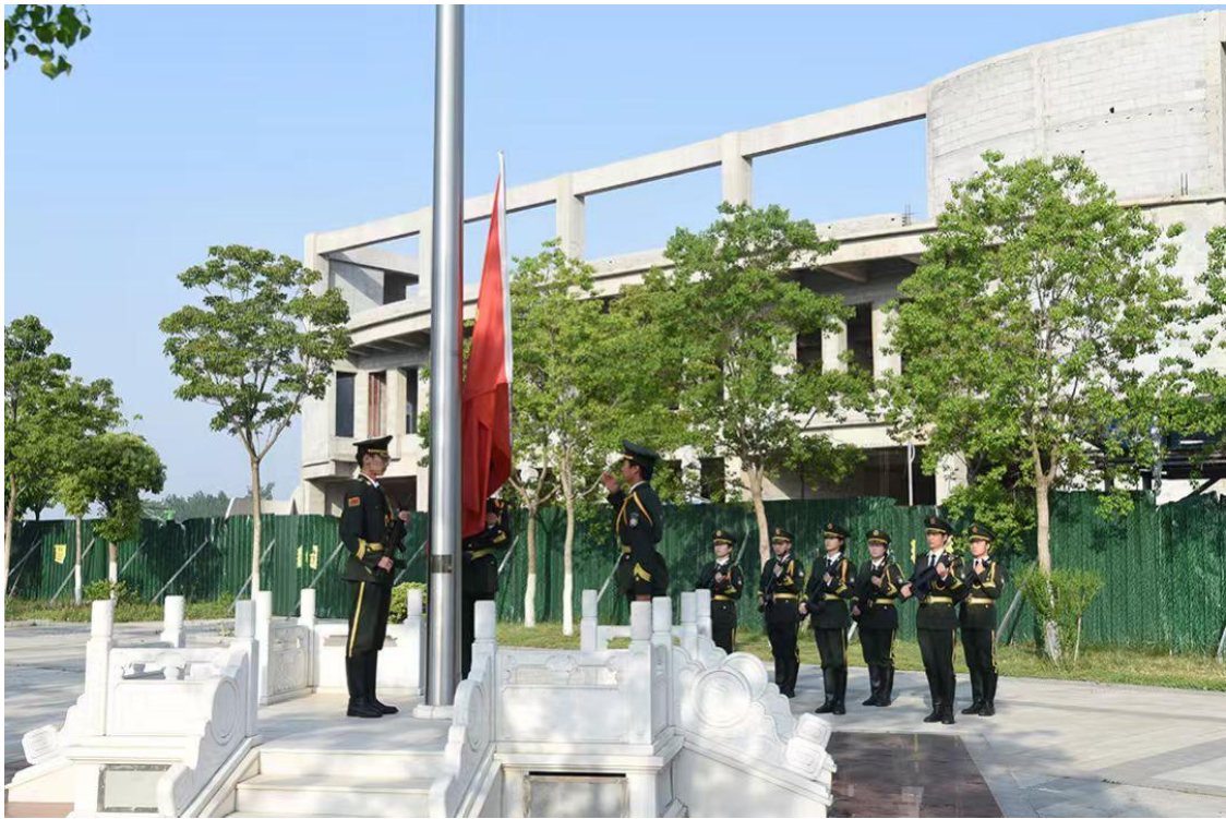
图 47：珠宝玉雕学院“全民反诈·守护平安”国旗队升国旗仪式