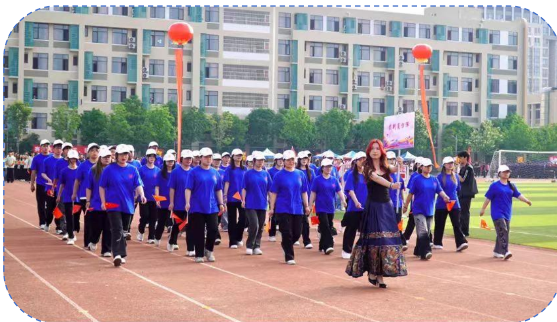
图 30: 运动会裁判员方阵