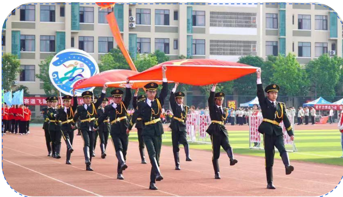
图 27：国旗护卫队、校旗卫队、校徽卫队