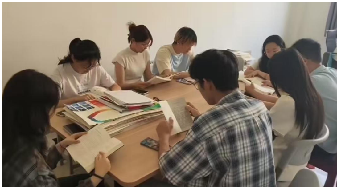
图 20：珠宝玉雕学院阅读分享会现场