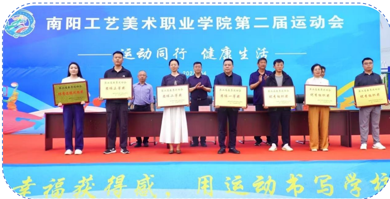
图 43：运动会集体颁奖仪式