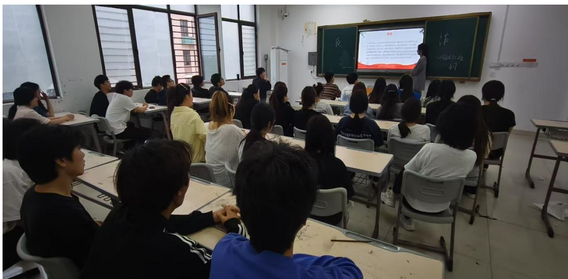
图 45：造型艺术学院“全民反诈”主题班会

2025年4月27日，我校召开“全民反诈”主题班会。围绕电信诈骗定义与主要运用手段，揭示发生电信诈骗原因，引导学生正确识别和学会防范电信诈骗。