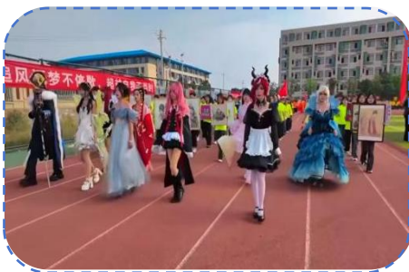
产品设计学院方阵表演