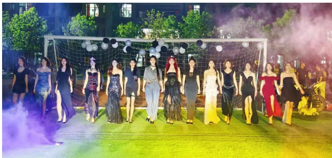
图 3：礼仪社团在操场举办走秀活动

2025年4月17日，南阳工艺美术职业学院礼仪社团在操场举办走秀活动，旨在通过活动招募新学员，展示社团风采，吸引更多对礼仪感兴趣的学生加入队伍，以此普及校园礼仪知识，提升学生的艺术审美和综合素质。