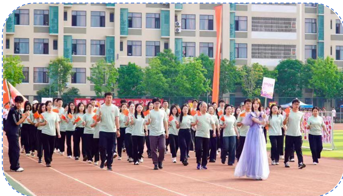
图 31：教师代表运动会方阵