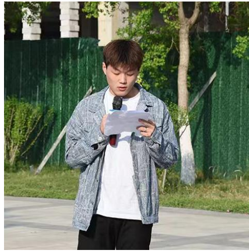
图 49：珠宝玉雕学院学生代表发表国旗下讲话