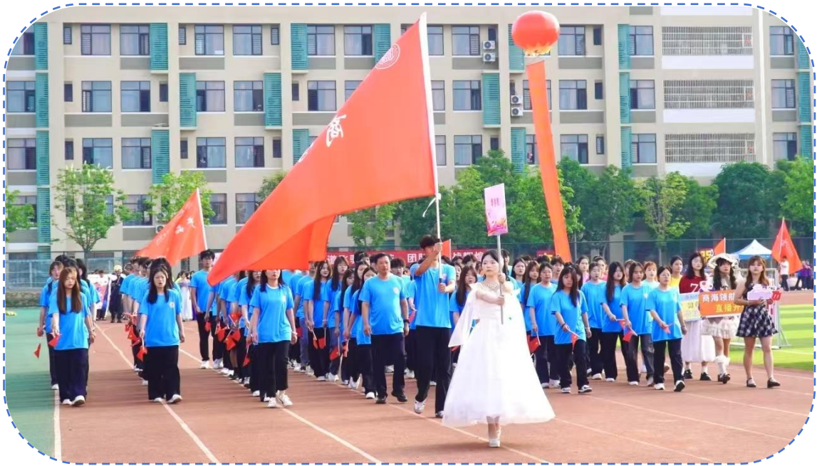
图 33：商学院运动会方阵