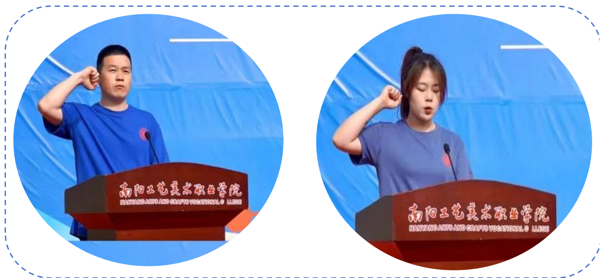
图 40：运动会裁判员代表、运动员代表赛前宣誓仪式