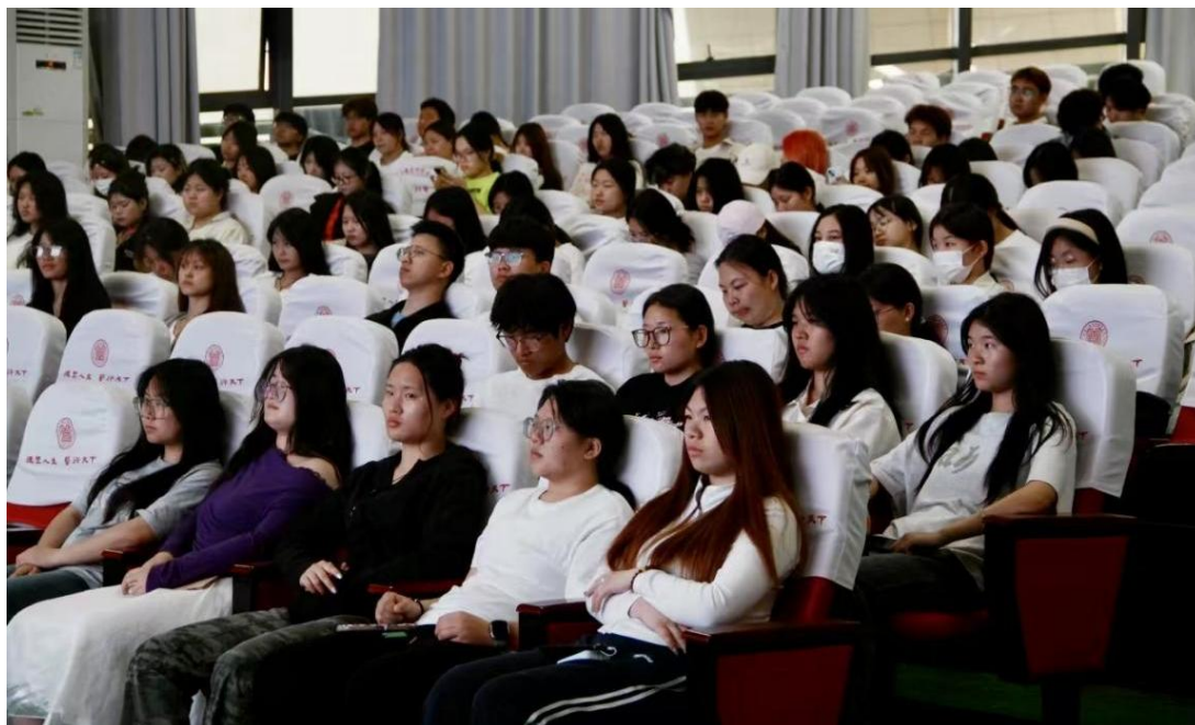
图 2：学生认真法律知识讲座