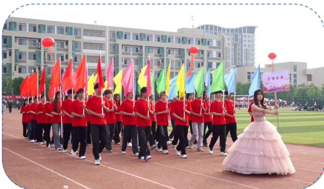
图 28：运动会彩旗方阵