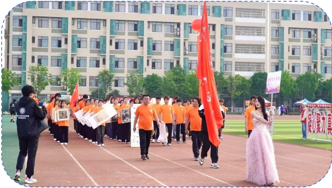
图 37：造型艺术学院运动会方阵