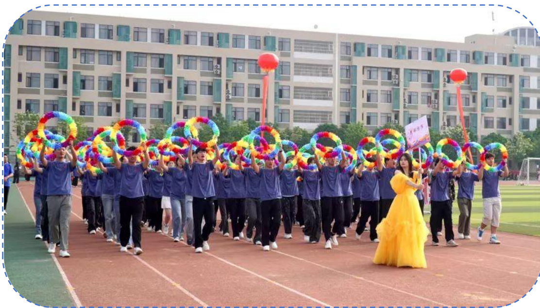
图 29: 运动会花环方阵