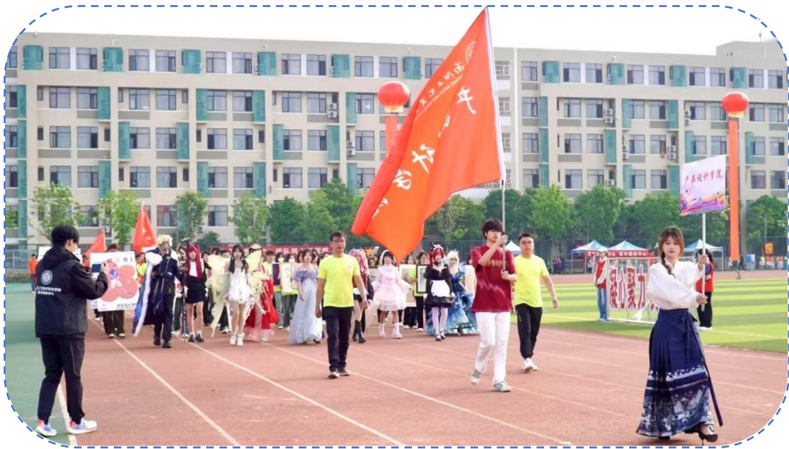
图 35：产品设计学院运动会方阵