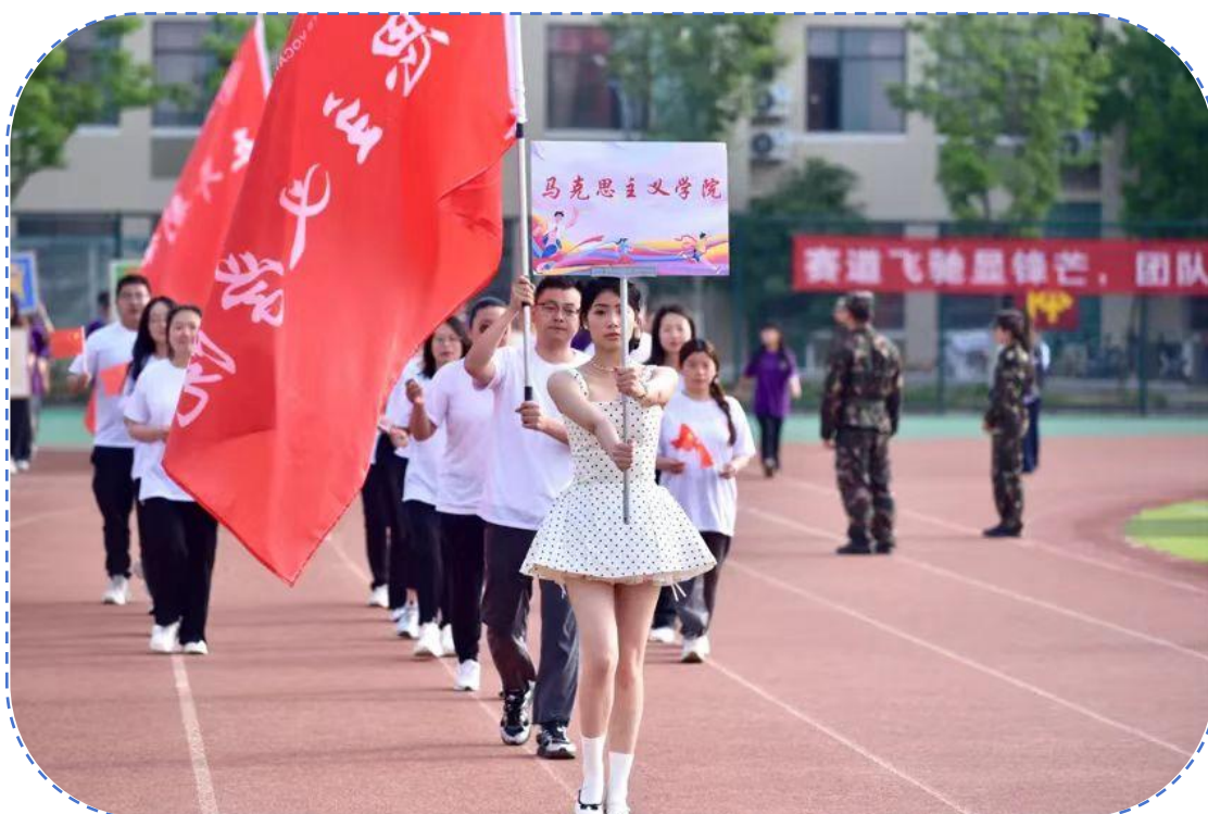
图 32：马克思主义学院运动会方阵