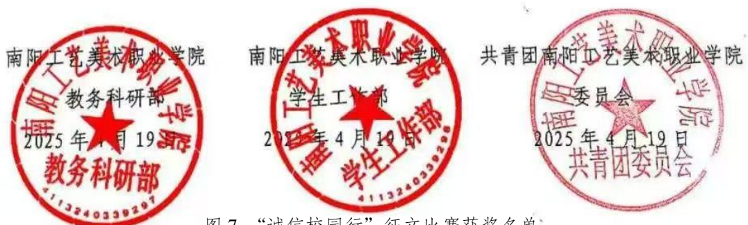
图 7：“诚信校园行”征文比赛获奖名单

此名单在全校范围内公示 5 个工作日，25.4.19-25.4.24，敬请关注！