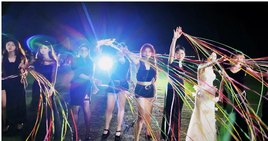
图 4：礼仪社团成员手抛彩带