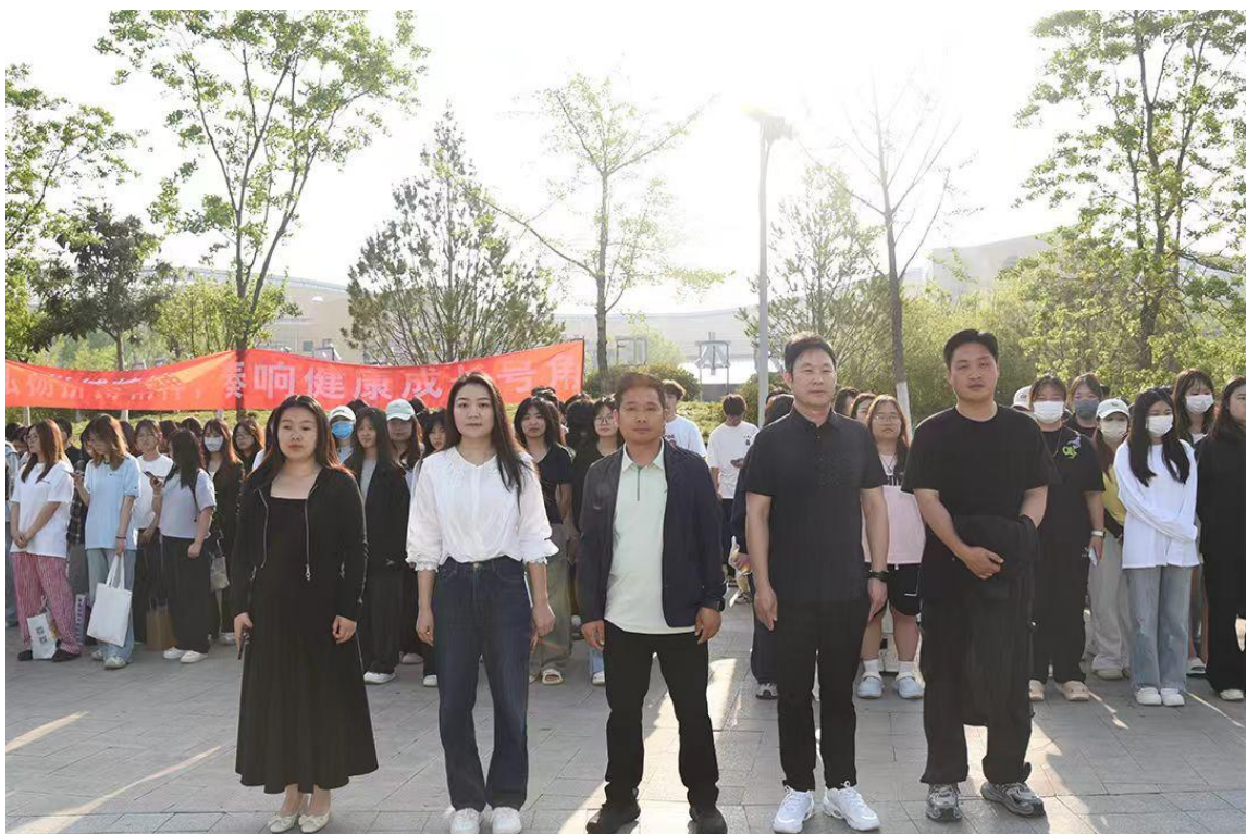
图 48：珠宝玉雕学院全体师生参加“全民反诈·守护平安”升国旗仪式